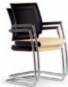
Konferenz-Freischwinger due46 , 3D Stricknetz Rücken. Gestell verchromt. Stapelbar bis max. 1+4.

Chairholder GmbH & Co. KG Weilerstr. 14 D-73614 Schorndorf Telefon: +49 (0)7181.9805-115 Telefax : +49 (0)7181.9805-100 Mail: info@chairholder.de www.chairholder.de