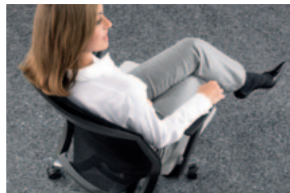
Rückenlehne. Vierseitig gefasstes 3D-Stricknetz. Formstabil und präzise verarbeitet für optimale individuelle Abstützung. Auch mit Polsterauflage.