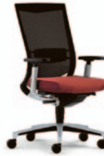
Drehstuhl due88 , 3D Stricknetz Rücken mit Lordosestütze, 4F-Armsupports alu-farbig. Alu-Fußkreuz alu-farbig.