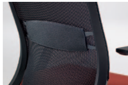
Lordosestütze , optional. Unterstützt den Lendenwirbelbereich und passt die Rückenlehne optimal an den Rücken des Benutzers an. Um 11 cm höhenverstellbar, nachrüstbar.