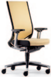
Drehstuhl due98 , 3D Stricknetz Rücken mit Polsterauflage, MF-Armsupports poliert, Alu-Fußkreuz poliert.