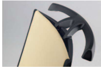
Kleiderbügel auf Design und Material abgestimmt, nachrüstbar.