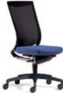
Drehstuhl due88 , 3D Stricknetz Rücken. Kunststoff-Fußkreuz L.