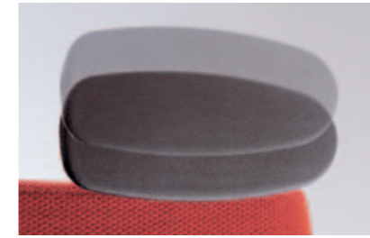
4F-Armsupports. Vier Funktionen: höhenverstellbar um 11 cm und horizontal nach vorne um 5 cm verstellbar. Armauflagen in der Breite um je 2,5 (+3) cm verstellbar und um 30° nach rechts/links schwenkbar. In alu-poliert, alu-farbig oder schwarz. Optional mit Lederauflage.