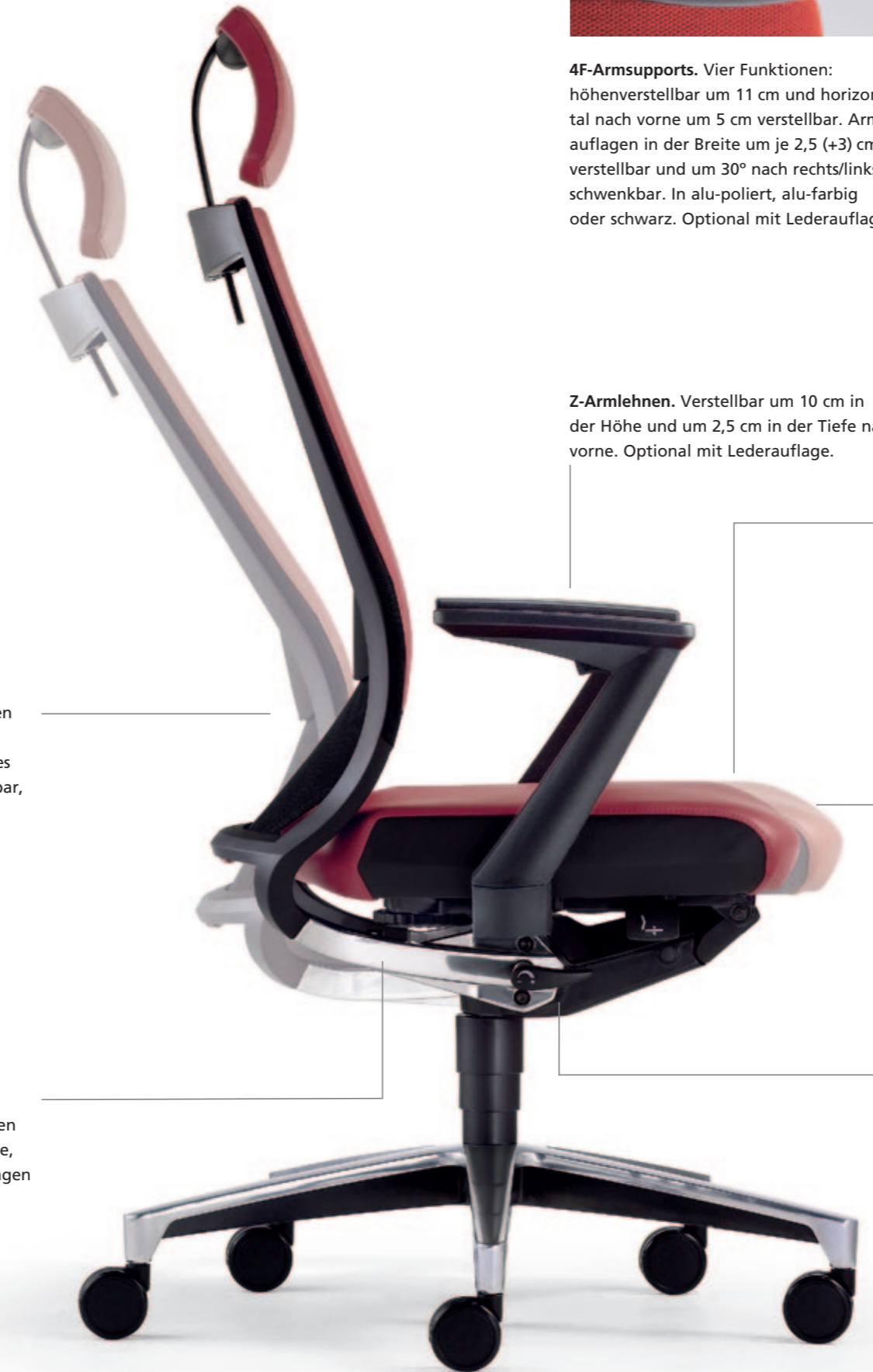
Z-Armlehnen. Verstellbar um 10 cm in der Höhe und um 2,5 cm in der Tiefe nach vorne. Optional mit Lederauflage.