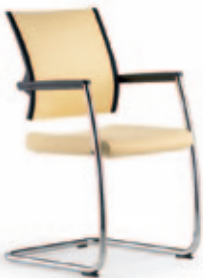
Konferenz-Freischwinger due56 , 3D Stricknetz Rücken mit Polsterauflage. Gestell verchromt.