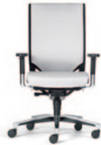
24-Stunden Drehstuhl due92 , 3D Stricknetz Rücken mit Polsterauflage, Komfort-Sitz, 4F-Armsupports poliert mit Stylingkappe. Alu-Fußkreuz poliert.