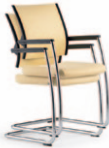
Konferenz-Freischwinger due56 , 3D Stricknetz Rücken mit Polsterauflage. Gestell verchromt. Stapelbar bis max. 1+4.