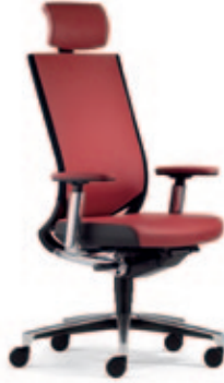
Drehstuhl due99 mit Kopfstütze, 3D Stricknetz Rücken mit Polsterauflage, 4F-Armsupports poliert. Alu-Fußkreuz poliert.