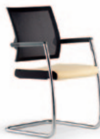
Konferenz-Freischwinger due46 , 3D Stricknetz Rücken. Gestell verchromt.