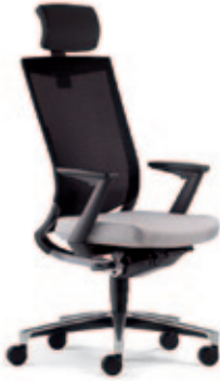
Drehstuhl due89 mit Kopfstütze, 3D Stricknetz Rücken, Z-Armlehnen, Alu-Fußkreuz poliert.