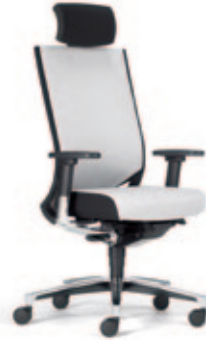
24-Stunden Drehstuhl due93 mit Kopfstütze, 3D Stricknetz Rücken mit Polsterauflage, Komfort-Sitz, 4F-Armsupports poliert mit Stylingkappe. Alu-Fußkreuz poliert.