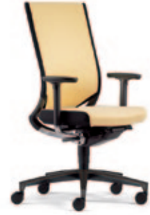
Drehstuhl due98 , 3D Stricknetz Rücken mit Polsterauflage, 3D-Armsupports, Alu-Fußkreuz schwarz.